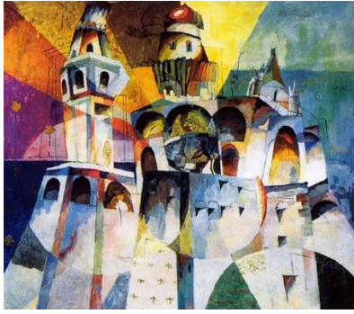
А. Лентулова. Звон (Колокольня Ивана Великого)

Представитель кубизма П. Пикассо стремился утвердить новые методы передачи пространства и формы, используя аналитический способ изображения предметов разложением их на простейшие геометрические объемы.