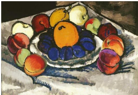
И. Машков. Натюрморт. Фрукты на блюде.

Фовисты создавали колористические контрасты интенсивных пятен и острые композиционные ритмы, часто обращаясь к примитивному, а также средневековому и восточному искусству. Декоративные натюрморты И. Машкова были созданы под влиянием кубистов и фовистов. Машкова называют «королем натюрмортов», и это звание вполне заслужено. «Фрукты на блюде» написаны в период освоения художником плоскостной живописи, жанра вывески.